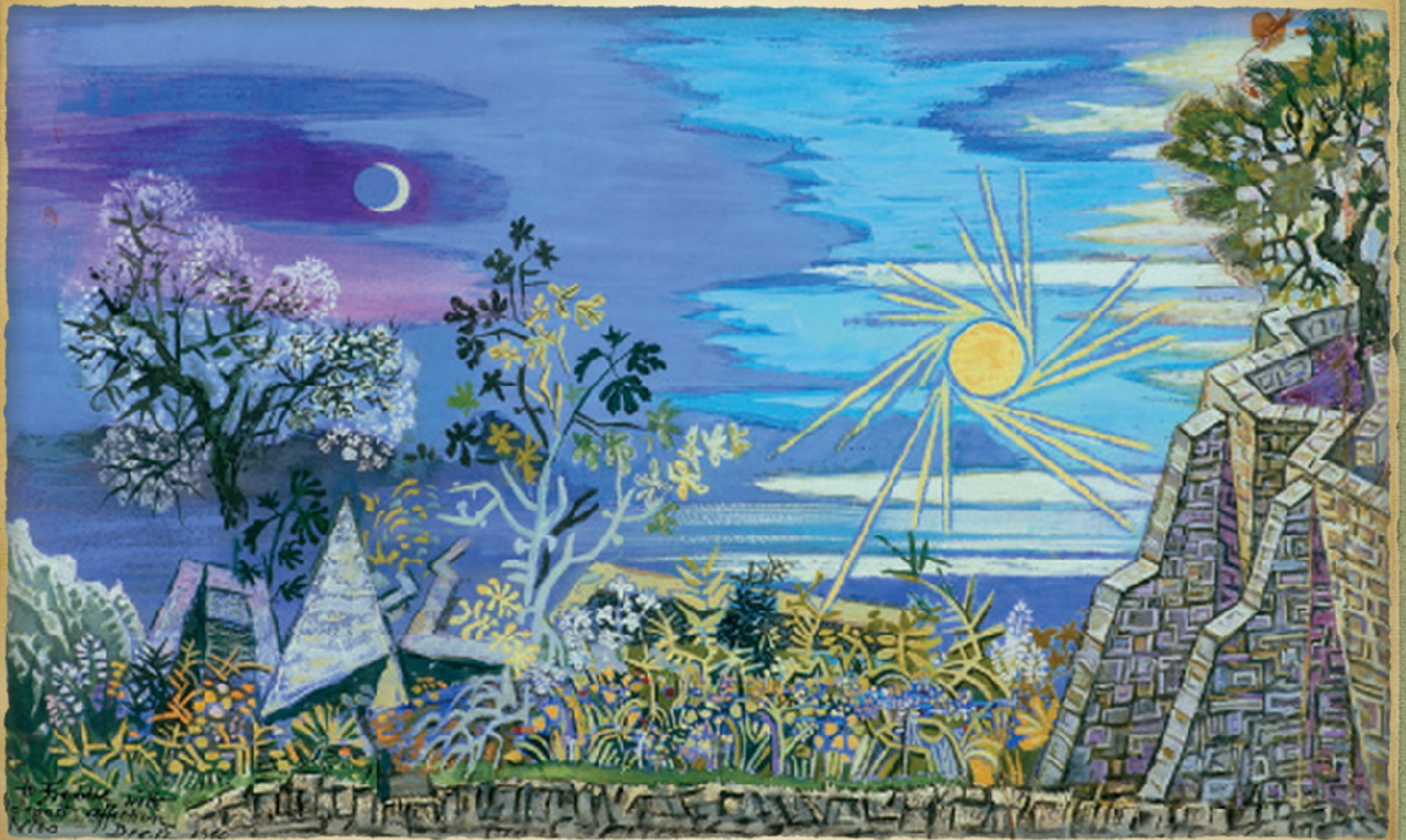
Το πρώτο πρωί του κόσμου, 1960 Νίκος Χατζηκυριάκος-Γκίκας