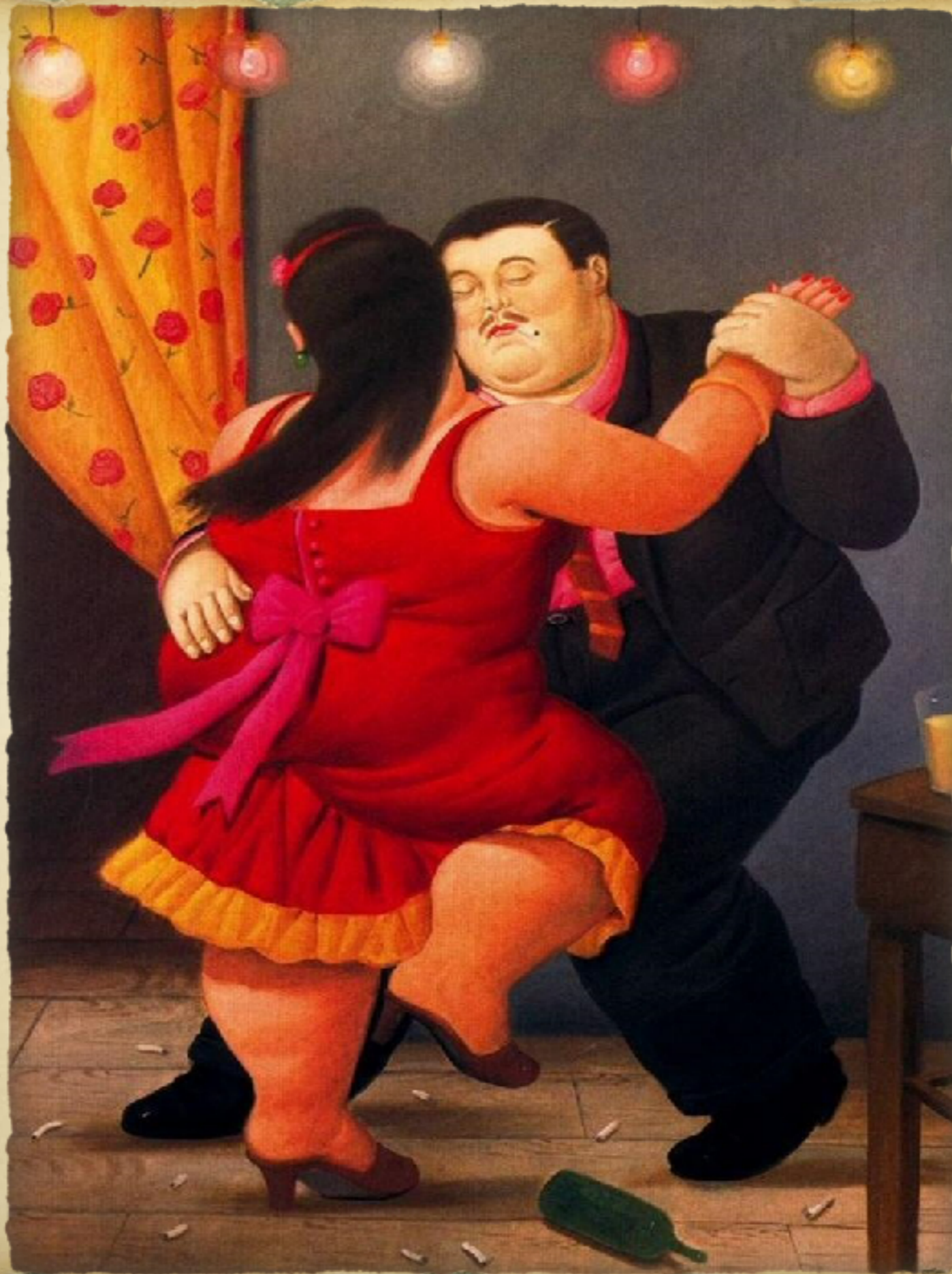
Dancers (2003) Fernando Botero