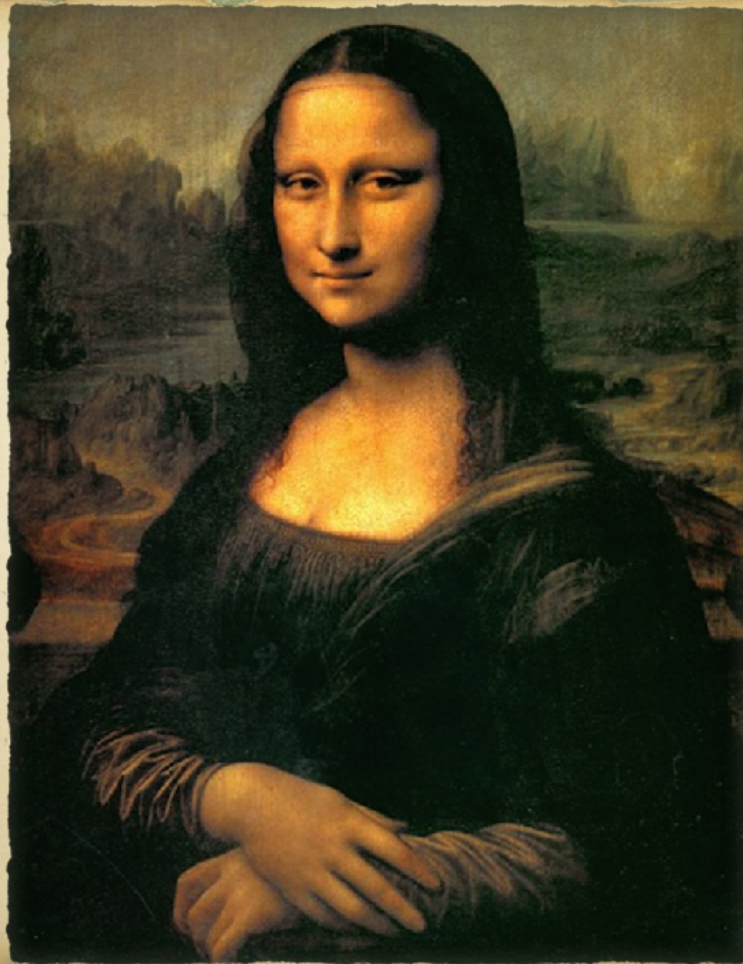
Mona Lisa (1503 - 06) Leonardo da Vinci