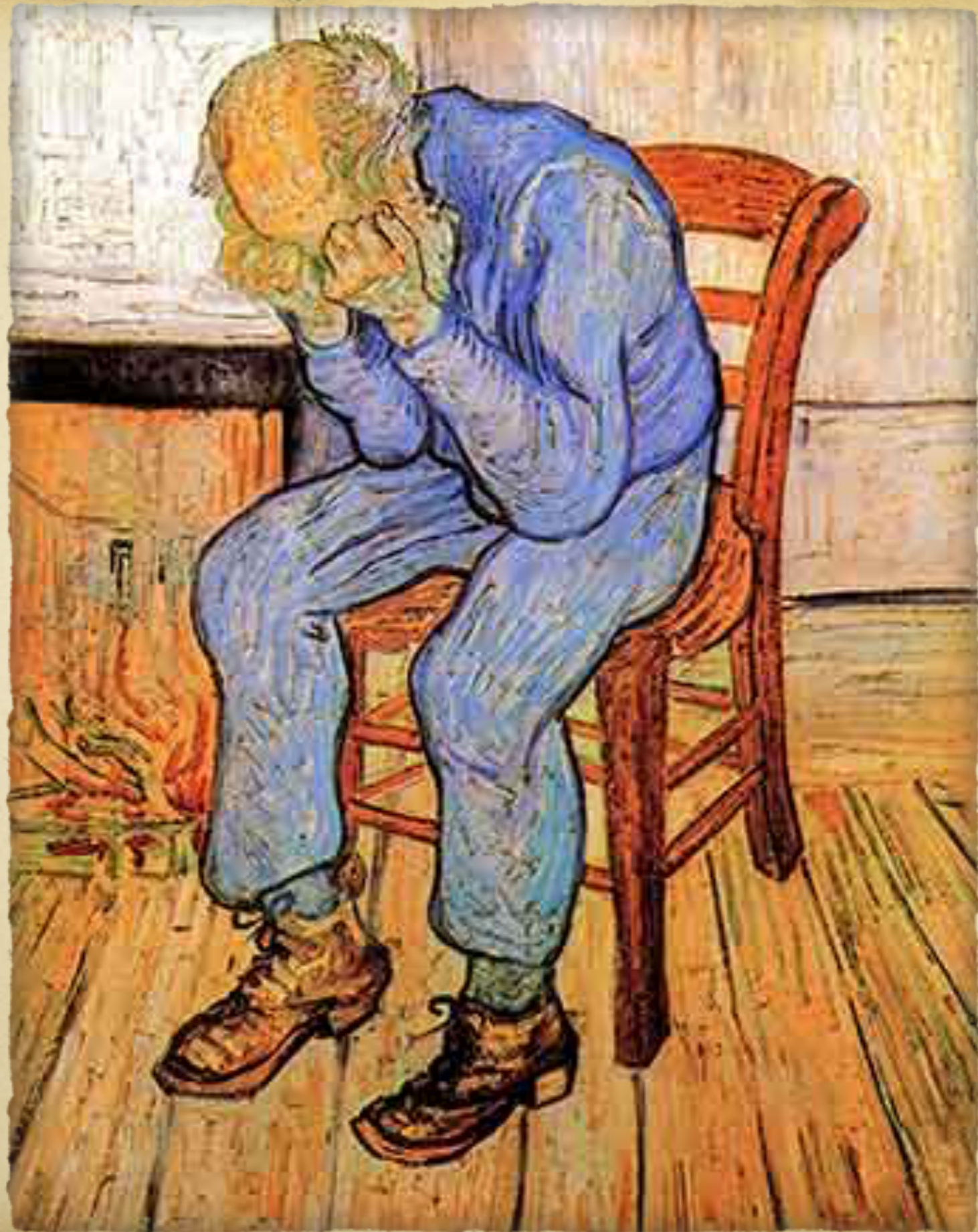
Γέρος άνδρας σε θλίψη (Στο Κατώφλι της Αιωνιότητας)