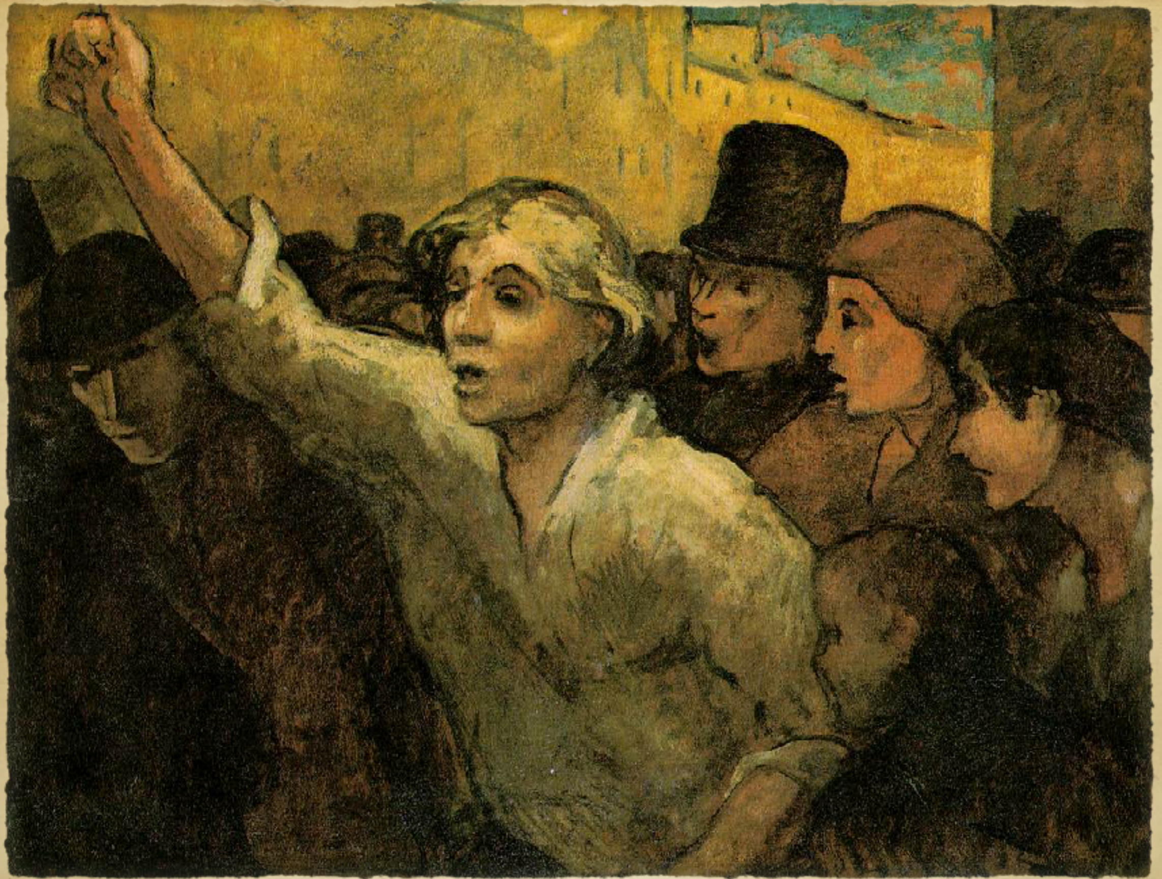
The Uprising, 1863, Honoré Daumier