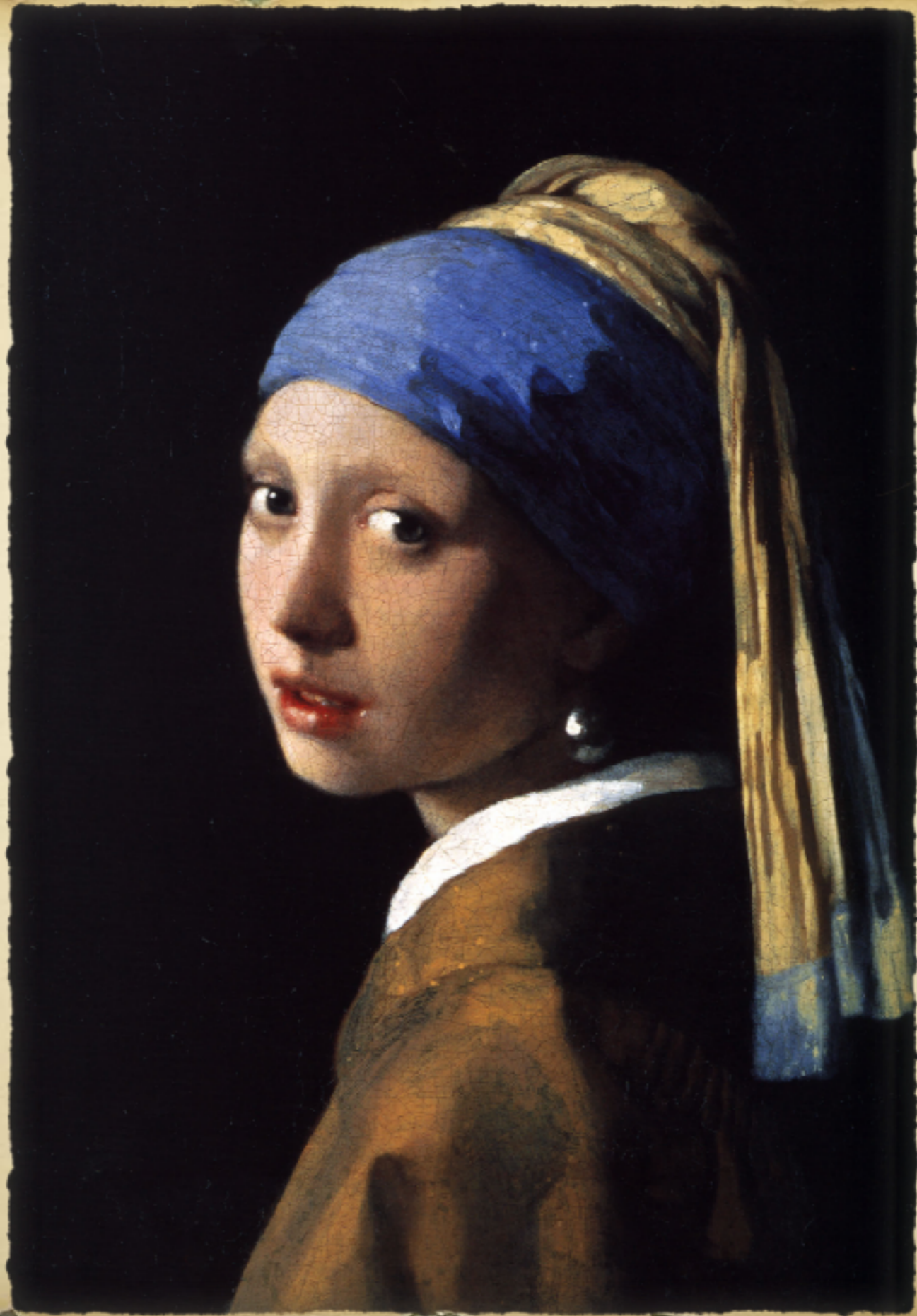
Girl with a pearl earring (1665 )