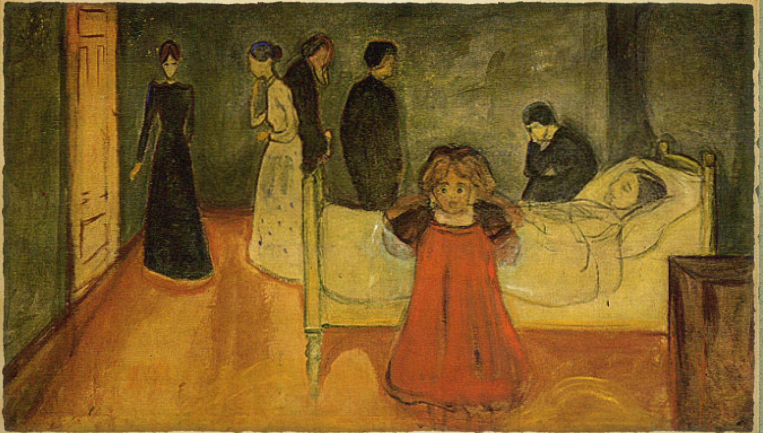
Death in the Sick Chamber (1899)