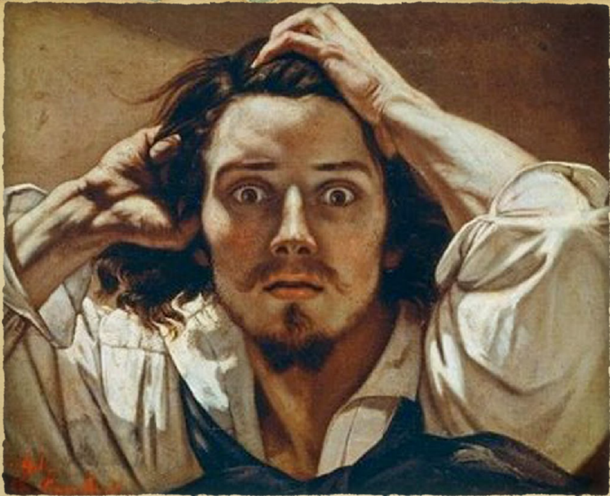
Le Désespéré (The Desperate Man, Ο απελπισμένος άνδρας), self-portrait, (1844 - 45), Gustave Courbet