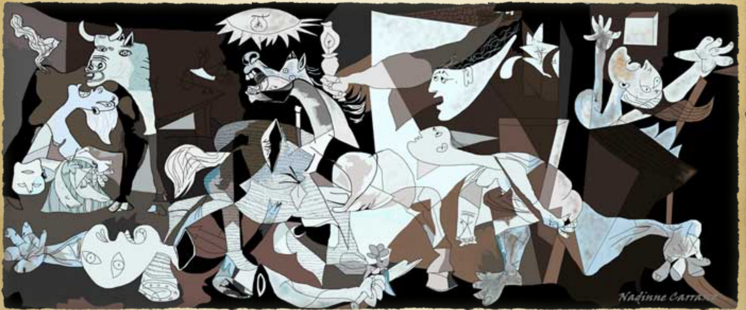
Guernica (Γκερνίκα) (1937) Pablo Picasso