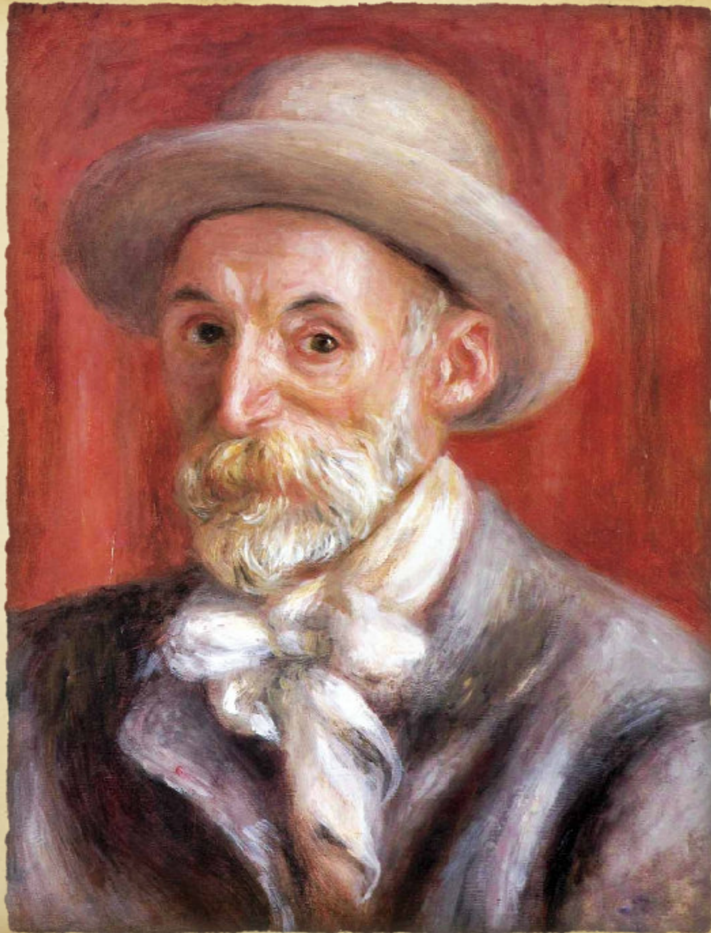
Self-Portrait, 1899 Pierre-Auguste Renoir