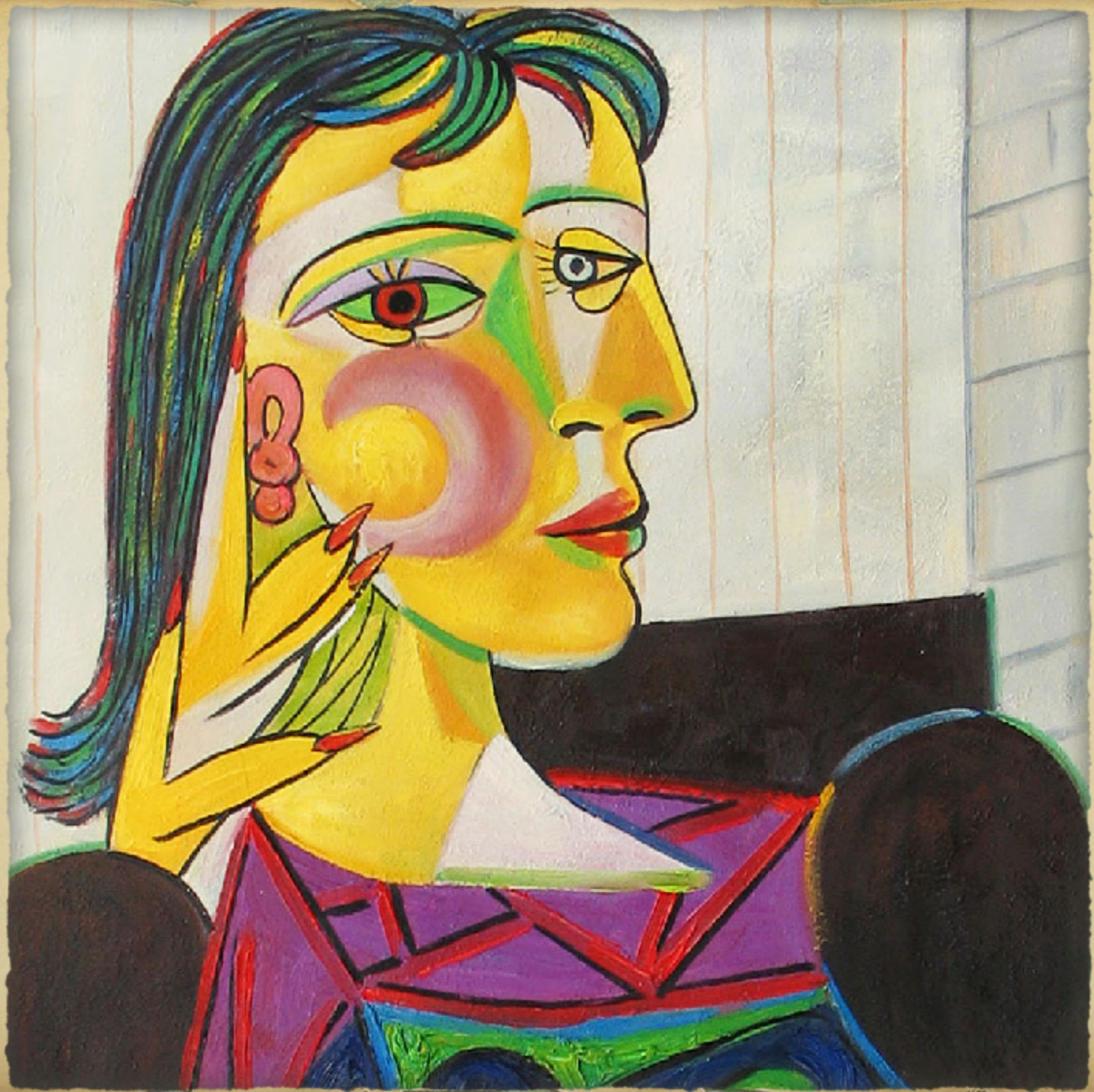
Portrait of Dora Maar (1937) Pablo Picasso