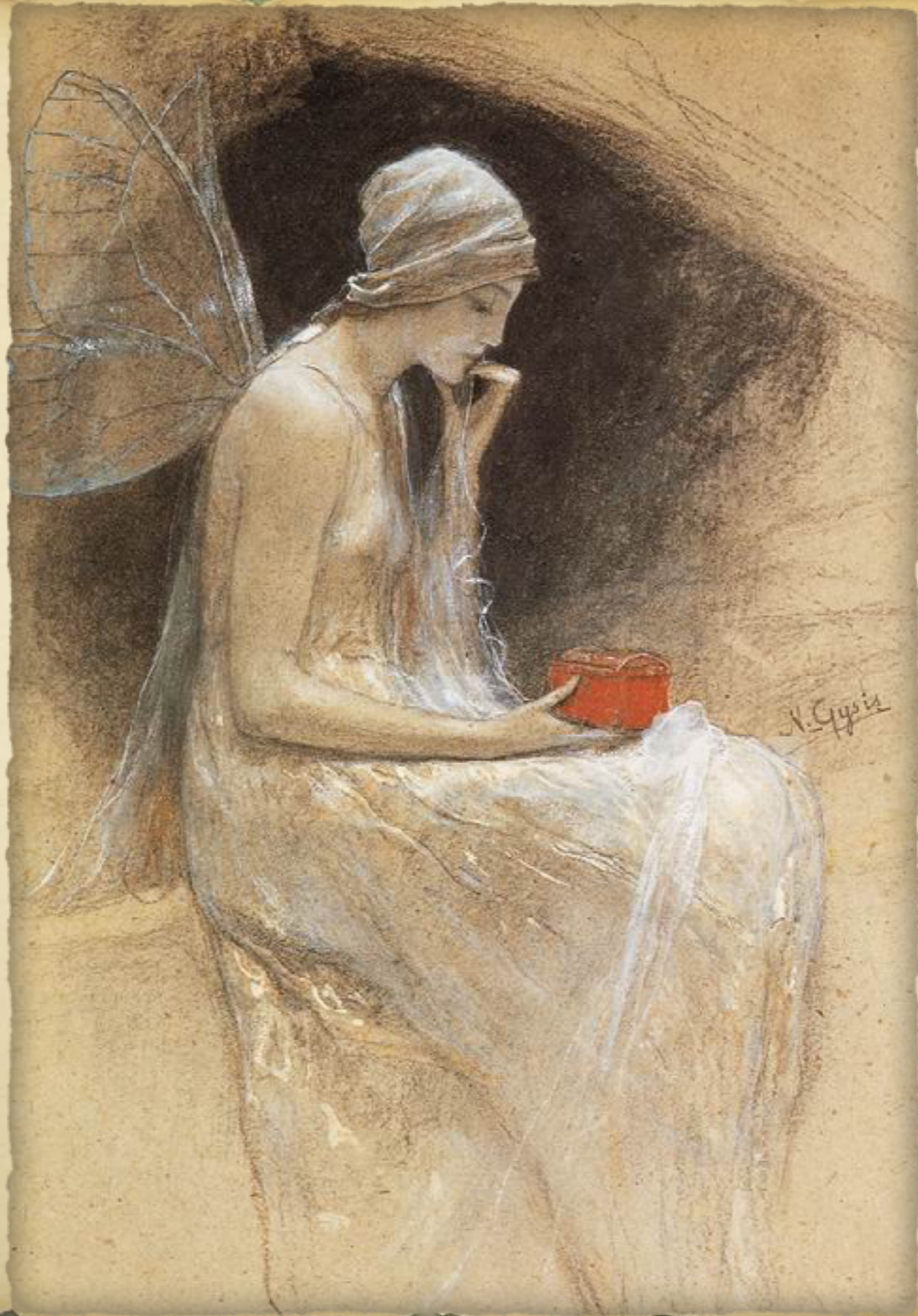
Η Ψυχή του Καλλιτέχνη (1893) Νικόλαος Γύζης